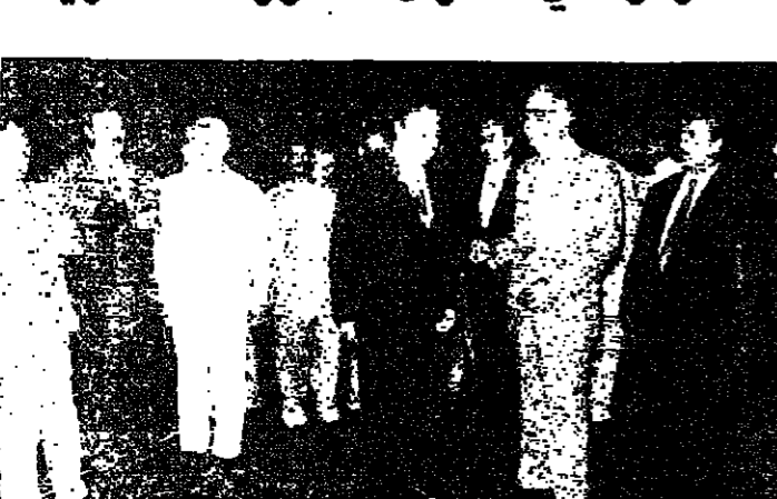
السفير حسن شفيح مرحبا بالرئيس الحص